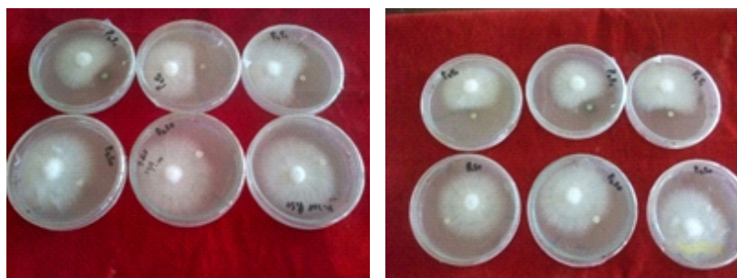
Gambar 2. Pertumbuhan jamur Cercospora oryzae (A) dan Rigidoporus microporus (B) yang diaplikasi dengan protein serum (atas) dan tidak aplikasi protein serum (bawah) pada pengamatan 6 hari setelah inokulasi (HSI)

Penghambatan terbesar terjadi pada spesies Fusarium oxysporum dan terendah pada Alternaria solani . Protein serum dengan konsentrasi 200 µg/mL sebanyak 25 µL memiliki daya penghambatan berkisar antara 13,70% hingga 33,18% (Tabel 2). Hal ini menunjukkan bahwa protein serum memiliki potensi dalam menghambat pertumbuhan jamur patogen namun konsentrasi yang digunakan masih belum optimum. Peningkatan konsentrasi protein menjadi 3 kali lipat (600-800 µg/mL) diduga