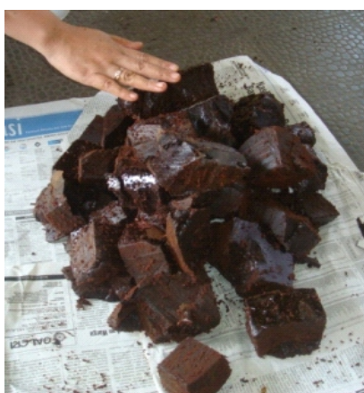
Gambar 3. Visualisasi fisik faktis coklat Figure 3. Physical visualization of brown factice

Dengan mempertimbangkan visualisasi fisik (Gambar 3) dan sifat kimia faktis coklat maka dapat diketahui faktis coklat dengan spesifikasi terbaik dan diujicobakan dalam pembuatan vulkanisat selang gas LPG adalah faktis coklat yang disintesis pada kapasitas sebesar 10 kg minyak/ batch dengan penambahan 0,5 bsm ZnO. Faktis coklat yang disintesis pada kondisi tersebut memiliki derajat ikatan silang antara trigliserida yang paling baik. Hal ini diperkuat dengan tingkat kekerasan faktis coklat yang tertinggi (18 Shore A). Terbentuknya ikatan silang antar trigliserida dalam faktis coklat menyebabkan minyak jarak semakin jenuh yang pada akhirnya memadat. Jalinan ikatan silang