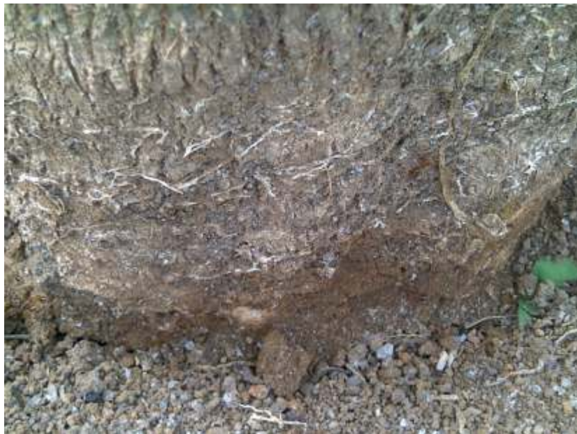
Gambar 3. Miselium JAP yang tampak mengering dan terkelupas setelah diaplikasi dengan biofungisida Endohevea .