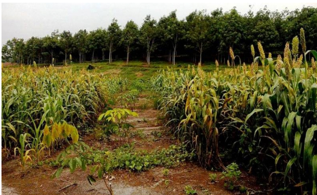
Gambar 5. Tanaman tumpangsari sorgum di gawangan TBM 1 Figure 5. Intercropping sorghum in the space of Immature Rubber year 1

Berdasarkan hasil analisa tanah dari lahan TBM 1 dan TBM 3 pra tumpangsari menunjukkan bahwa kondisi tanah di lahan tersebut memiliki tingkat kesuburan yang tergolong rendah dan tingkat kemasaman