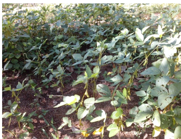
Gambar 4. Tanaman tumpang sari kedelaidan sorgum di gawangan TBM 3 Figure 4. Intercropping soybean and sorghum in the space of Immature Rubber year 3

terganggu (Gambar 4). Tanaman sorgum juga mengalami penghambatan pertumbuhan sehingga tinggi tanamannya hanya sepertiga dari pertumbuhan tanaman di TBM 1. Pertumbuhan terhambat disebabkan karena tajuk tanaman karet yang sudah mulai menutupi areal gawangan, sehingga intensitas cahaya matahari terbatas dan fotosintesis terhambat.