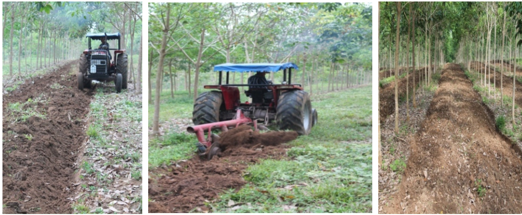
Gambar 1. Pengolahan tanah di gawangan TBM 3 Figure 1. Tillage in the space of Immature Rubber year 3

hama penyakit tanaman. Untuk pemupukan tanaman kedelai, diberikan urea, SP36, dan KCl masing-masing 25, 100, dan 75 kg/Ha pada saat tanam berumur 7 hari setelah tanam, dan disusul urea 25 kg/Ha pada saat tanam berumur 21 hari setelah tanam. Pupuk diberikan secara larikan 5-7 cm dari barisan tanaman. Sedangkan untuk pemupukan tanaman sorgum mengikuti dosis yang dianjurkan yaitu 200 kg/Ha urea, 100 kg/Ha SP36, dan 50 kg/Ha KCl. Pupuk diberikan secara larikan 5-7 cm dari barisan tanaman.